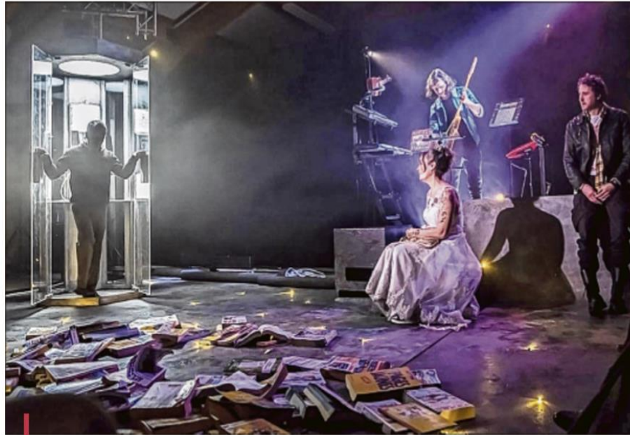
"Allosaurus (même rue même cabine)" de Jean-Christophe Dollé, à voir au 11. Avignon jusqu'au 29 juillet.

Dans Allosaurus , tout y est vu de manière originale, im-